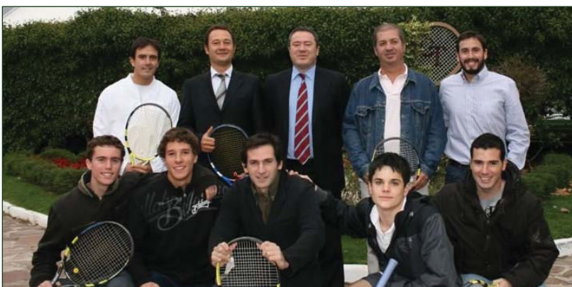
Miembros del equipo absoluto de tenis

27 de Oct. Las pistas de tierra batida del Club Tenis Pamplona fueron testigo de un emocionante fin de semana en el que se consumó la permanencia del club navarro por 18ª año consecutivo. El Club Tenis Valladolid 2006 fue el rival en la eliminatoria definitiva, un conjunto que cuenta con un equipo creado para estar entre los grandes del tenis nacional y que cuenta con tres tenistas entre el top 100 nacional.