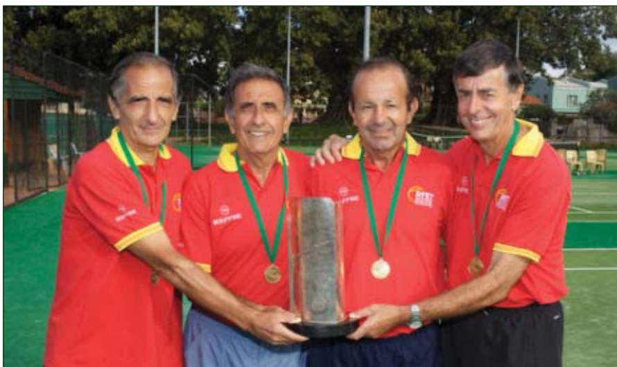
Equipo nacional Campeón del mundo de veteranos

En su camino hacia la victoria, España superó por 3-0 a Suiza, por 2-1 a Canadá y por 2-1 a Gran Gran Bretaña. Francia se alzó con