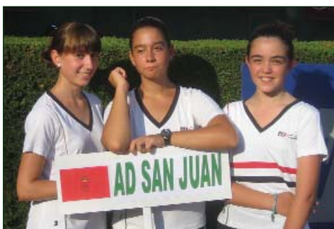
Equipo de A. D. San Juan